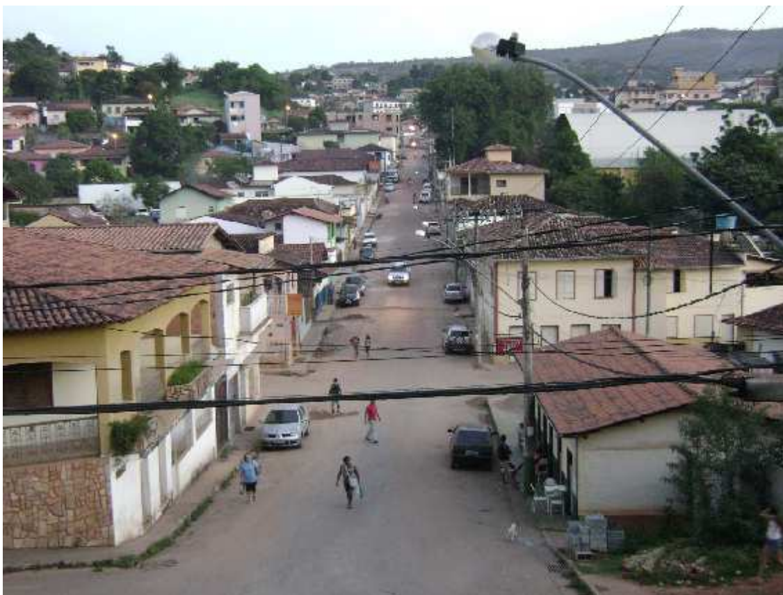
Fotografia 3. Fotografia do bairro Brejo em Conceição do Mato Dentro, tirada em maio de 2012.

pessoas que moram na área de entorno, momento de ouvir as palavras daqueles que viviam no corpo os impactos do empreendimento.