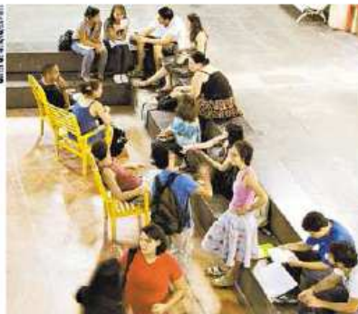
No UFMG, alunos de design de moda sofrem com falta de professor e espaço apertado; em Mariana, biblioteca de ciências sociais da Ufop é apenas prateleira