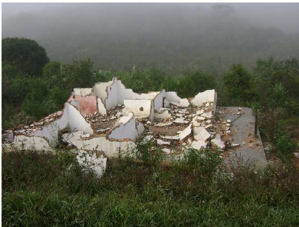
Fotografia1. Fotografia de uma casa demolida na comunidade da Água Santa. Dia 1º de junho de 2012.