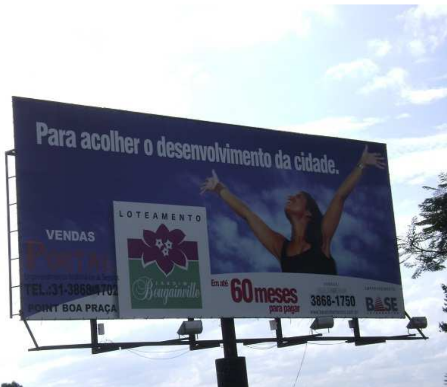
Fotografia 5. Fotografia de peça de publicidade sobre um novo loteamento em CMD tirada em abril de 2012.

mineradora é, exatamente, uma expectativa de efetivo desenvolvimento, elemento que garante o apoio da população local ao acontece na região. Se a intensa circulação de dinheiro no MatoDentro responde de forma rápida aos anseios locais, os moradores esperam também por melhores condições de educação, saúde, trabalho e de opções de cultura e lazer.