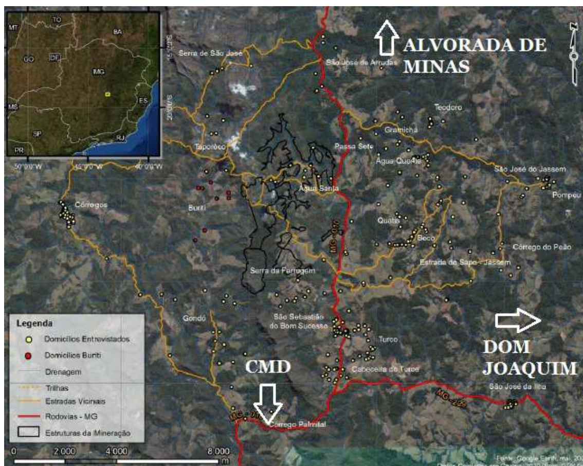
Mapa 1. Mapa da região de instalação da mina do Sistema Minas-Rio. (Fonte original: Diversus, 2011. As indicações dos nomes das três cidades da área de influência foram acrescentadas pelo autor) 31

A história de ocupação dessa região se confunde com a história oficial do próprio Estado de Minas Gerais. Com a descoberta e exploração do ouro e do diamante são fundadas as primeiras vilas, na região hoje nomeada como Minas Gerais. E desde o final do século XVII, quando foram descobertas as primeiras jazidas, até os dias de hoje, a mineração é um dos mais importantes eixos de desenvolvimento econômico do Estado. “Entre 1690 e 1695 o sonho português concretizou-se: os bandeirantes descobriram ouro na Serra da Mantiqueira, na região do atual Estado de Minas Gerais” (MARTINS, s/d, p.9). Com a descoberta dos metais em diferentes lugares foram formadas aglomerações bandeirantes, constituindo as cidades que hoje recebem os nomes de Ouro Preto, Mariana, Serro, Minas Novas, e também Conceição do Mato Dentro. É ao redor dos sítios de descoberta desses metais preciosos que florescem os