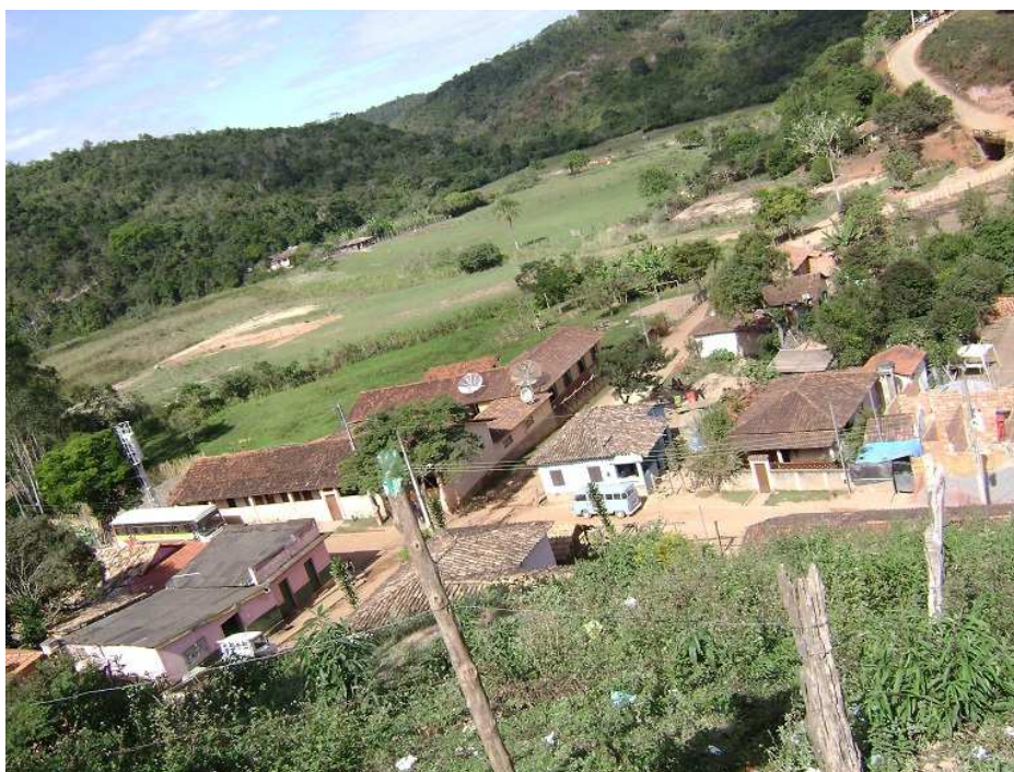
Fotografia 4. Fotografia do distrito de São José do Jassém, tirada em agosto de 2012.

Além dos efeitos mais genéricos sobre todo o território há também situações específicas em determinadas localidades. Por se tratar de um projeto com alguma complexidade, a localização específica de estruturas do empreendimento gera problemas e anseios no local de instalação de tais estruturas. Em São José do Jassém , por exemplo, o que mais preocupa as pessoas do lugar é que a barragem de rejeito será construída em terreno acima do nível da comunidade, assim um possível rompimento da barragem poderia causar uma tragédia no distrito.