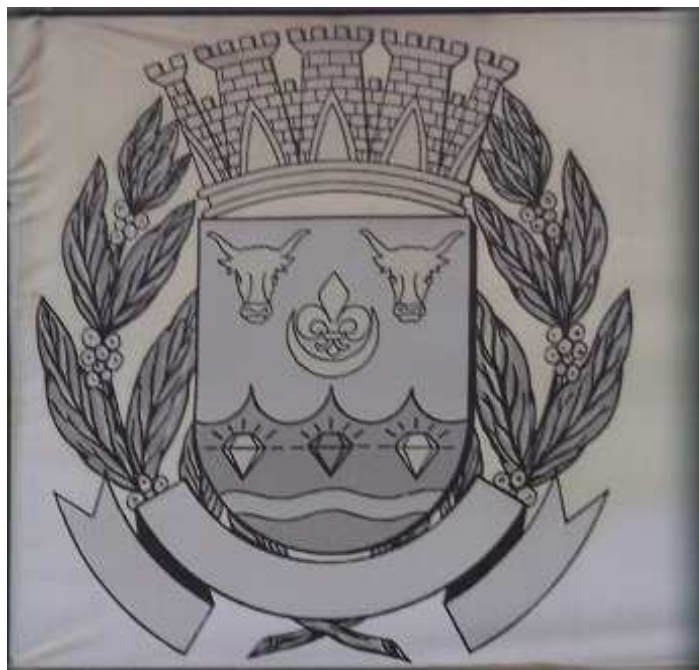
Fotografia 2. Fotografia do Brasão do município de Conceição do Mato Dentro, tirada na frente da Câmara Municipal de CMD no 01 de junho de 2012.

Com o fim da exploração do ouro, parte dos milhares de homens e mulheres que haviam se deslocado para a região se fixa e passa a viver principalmente da agricultura e troca de víveres. Os casarios antigos, as peças sacras e outros artefatos testemunham de forma opaca o brilho e riqueza desses outros tempos. As três centenas de anos que existem, entre a fundação da cidade e a divulgação do projeto Minas-Rio , mostram o início de um novo ciclo de exploração dos metais na região. A mudança do tempo se fez acompanhar de transformações sócio-políticas radicais, o que impede qualquer comparação superficial entre a situação atual e a época colonial. Apenas o interesse mercantil nos metais e o domínio do poder econômico permanecem os mesmos, intocados pela ação do tempo.